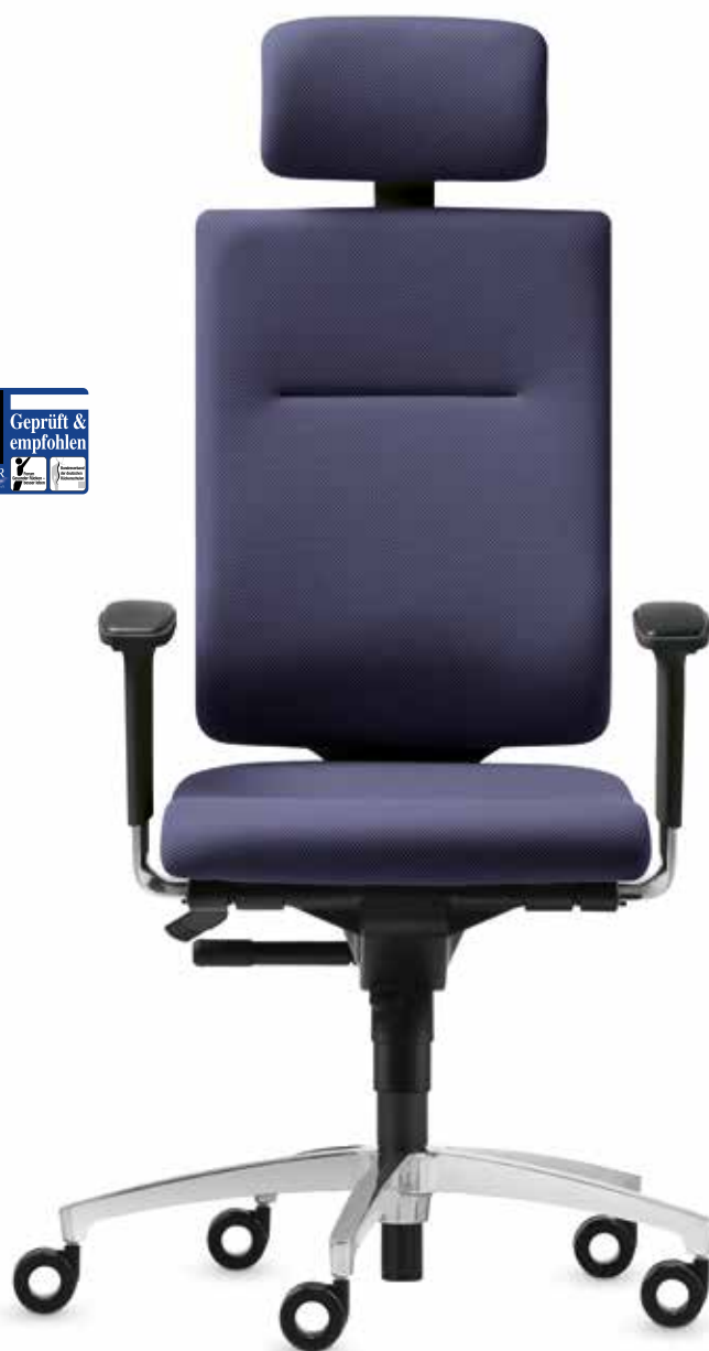
SD IT 5430 + Armlehnen | Armrests A204APO