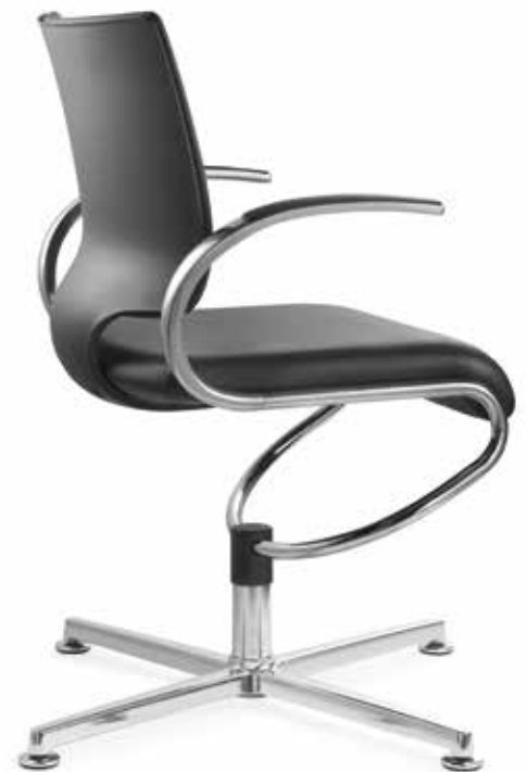
IT 5409 Armauflagen (PU) | Armpads (PU) AA03KGS