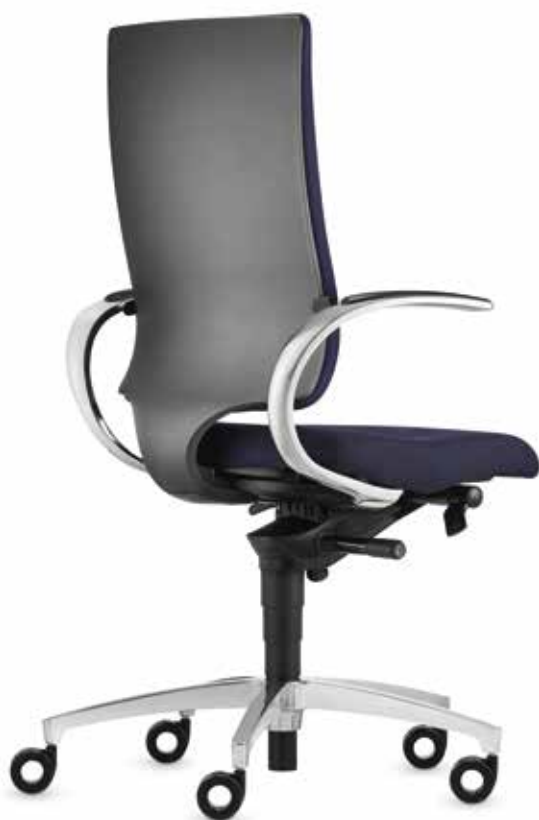
SD IT 5410 + Armlehnen | Armrests AS13APO