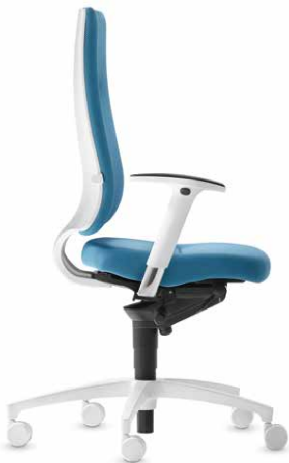
SD IT 5410 + Armlehnen | Armrests A204APO