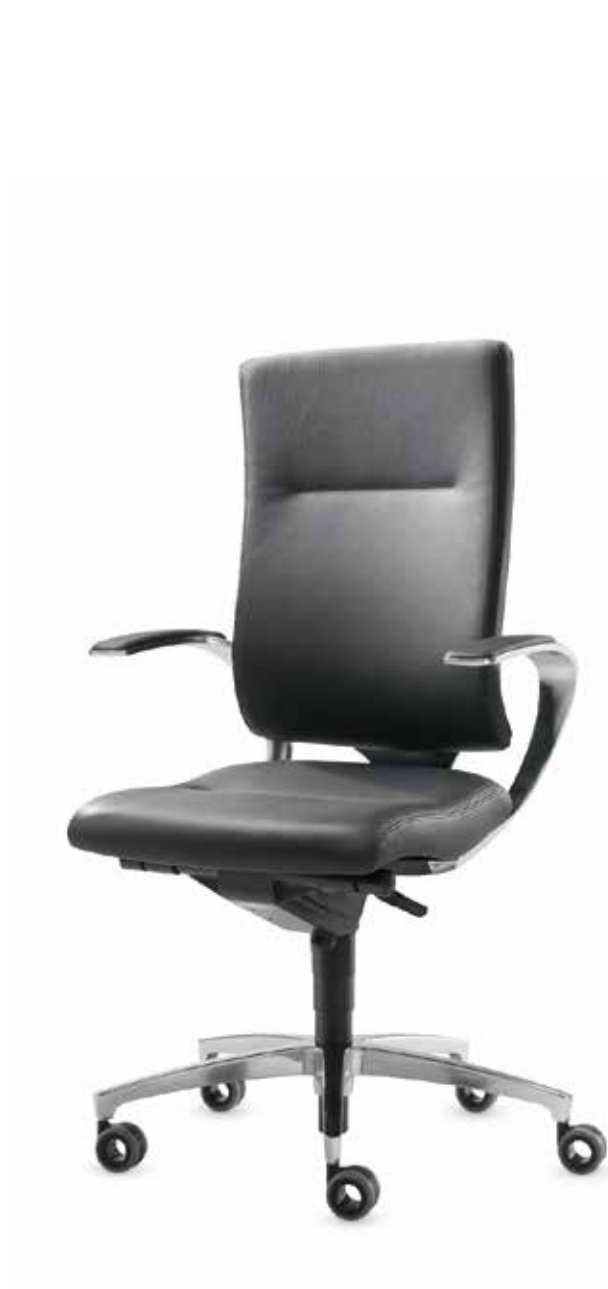
SD IT 5440 + Armlehnen | Armrests AS14APO