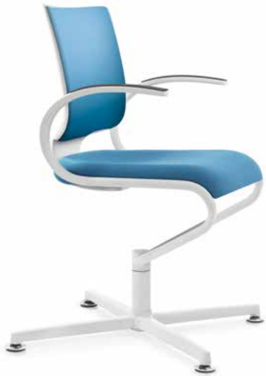
IT 5409 Armauflagen (PU) | Armpads (PU) AA03KGS

InTouch follows the movements of its user with its three-piece seat shell and backrest which is modelled on the shape of the body, and thus ensures perfect harmony for the person sitting on it. With a sleek organic design, the elastic and flexible Dauphin seat system supports the entire posture and locomotor system at all times in direct contact with the body. The white edition exudes fresh elegance and brings every detail of the dynamic design to the fore.