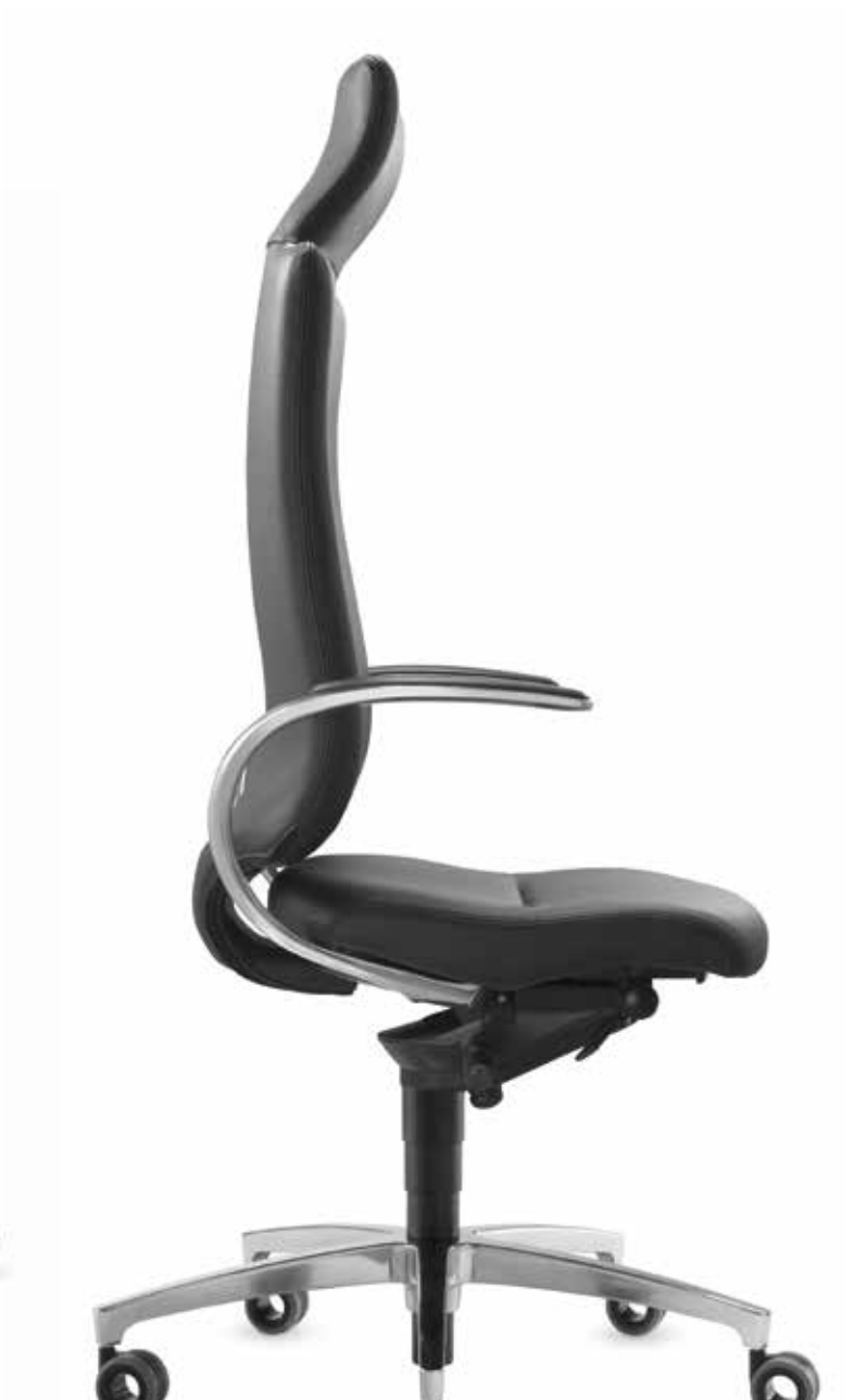
SD IT 5450 + Armlehnen | Armrests AS14APO