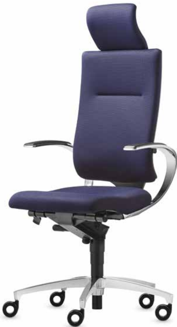
SD IT 5420 + Armlehnen | Armrests AS13APO

A classic through and through. As a design scheme, “black” is classically beautiful – and never fails to excite. Concentrating on what is essential focuses attention on form and functions. The chair exudes presence, yet allows ample scope for creativity. With their bold design, the loop armrests are not only comfortable but also emphasise the InTouch swivel chairs’ organic lines. The conference chairs carry on the fine line set by the office swivel chair.