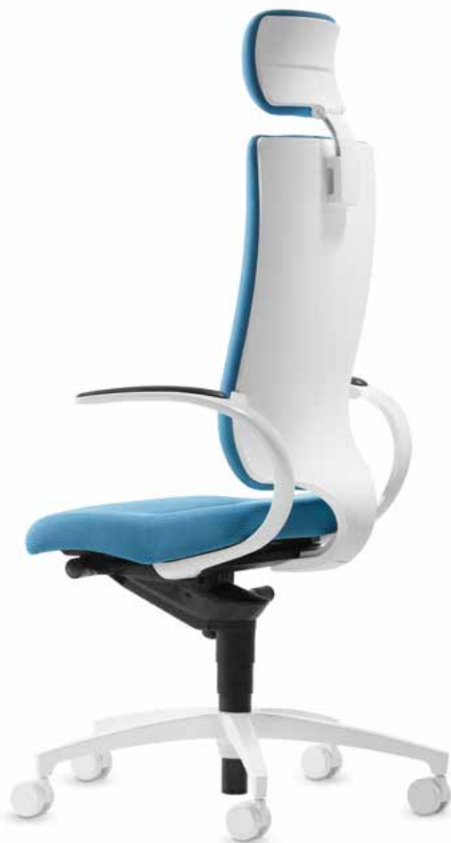
SD IT 5430 + Armlehnen | Armrests AS13AVW