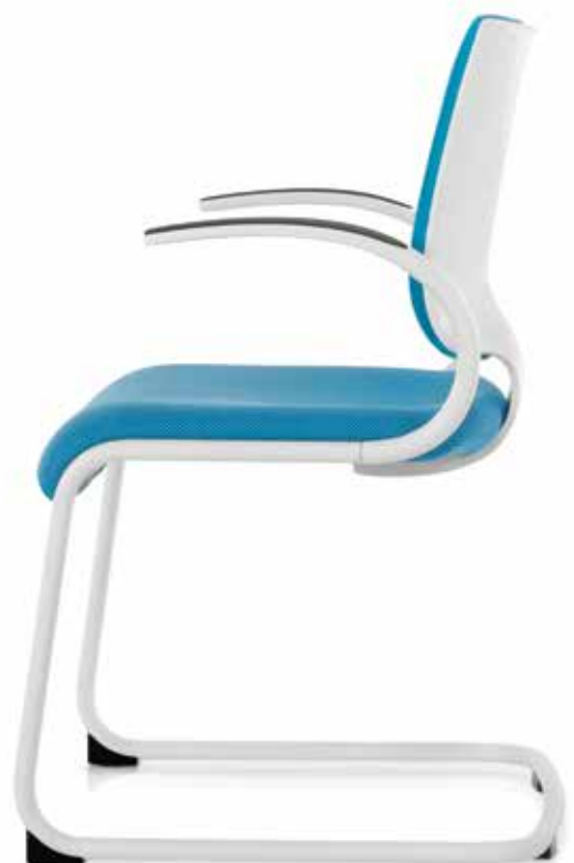
IT 5405 Armauflagen (PU) | Armpads (PU) AA03KGS