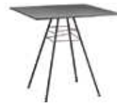
h 74 cm | 29 1/8"