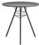
h 74 cm | 29 1/8"