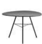
h 50 cm | 19 5/8"