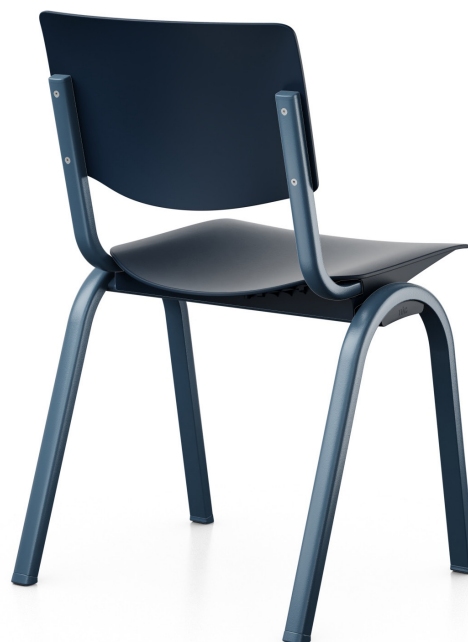
Design: BIG-GAME und Flokk Design Team.